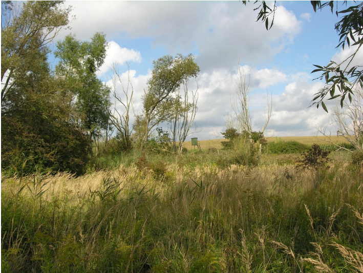
Tagebau der Grube 321 Unterabtei - Feuchtgebiet mit Ried; Blick NE