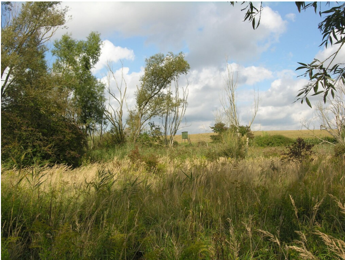
Tagebau der Grube 321 Unterabtei - Feuchtgebiet mit Ried; Blick NE

Schlagwörter: Tagebau Fachsicht(en): Denkmalpflege Gemeinde(n): Hohenmölsen Kreis(e): Burgenlandkreis Bundesland: Sachsen-Anhalt