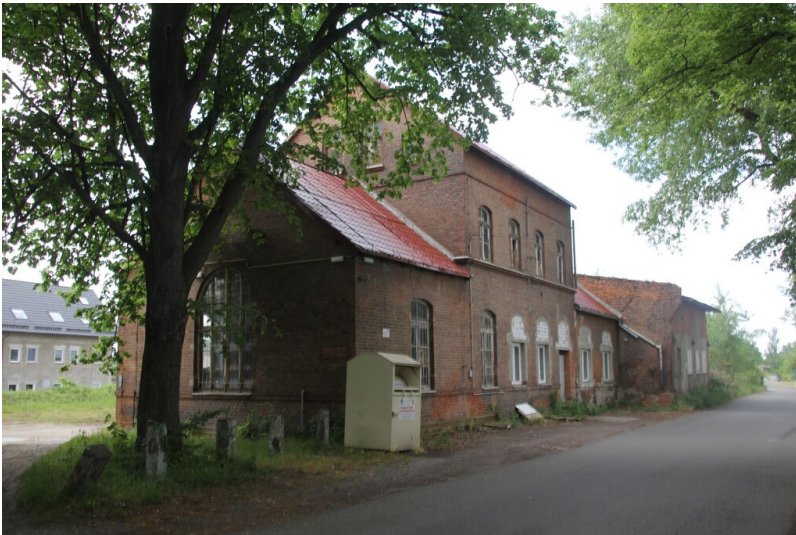
Bahnhof Webau - Bahnhof Webau Vorplatz Gesamtansicht