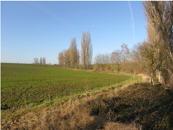
Kohlebahn zwischen Grube Gustav und Grube Taucha - Trassenführung entlang ehemaliger Feldwege