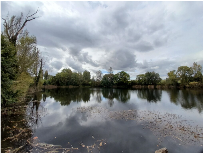
Tagebau der Grube Taucha - Blick nach Süden