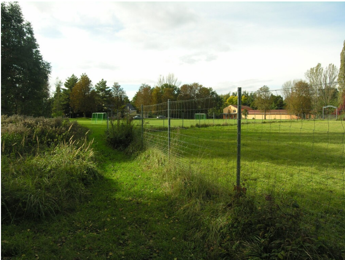
Aschhalde der Schwelerei Grube Taucha - Der Sportplatz wurde über der geplanten Aschehalde angelegt; Blick NW