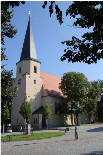
St. Petri - Gesamtansicht strassenseitig