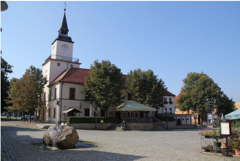
Rathaus Hohenmölsen - Gesamtansicht marktseitig