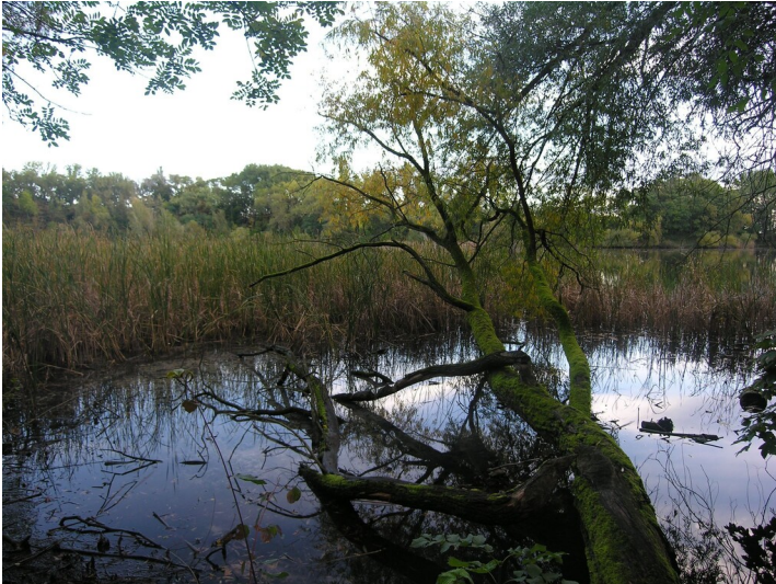
Tagebau der Grube 354 - Tagebaurestloch mit "Auensee"; der südöstlich Bereich naturbelassen, gegenüber ein Strandbad.

Schlagwörter: Tagebau Fachsicht(en): Denkmalpflege Gemeinde(n): Hohenmölsen Kreis(e): Burgenlandkreis Bundesland: Sachsen-Anhalt