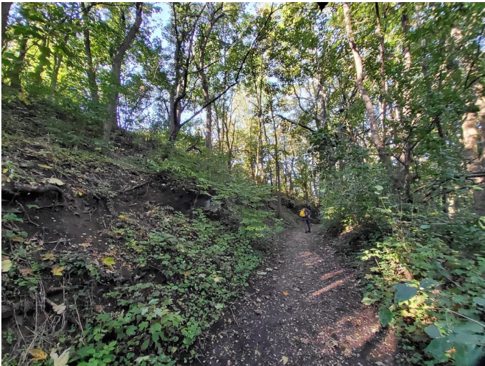
Aschehalde der Schwelerei Alt-Gerstewitz - Aufschluss verschiedenfarbiger Ascheschichten am Gerstewitzer Weg; Blick W