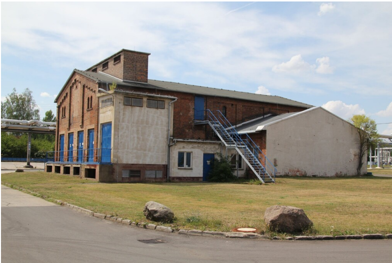
Fabrik Gerstewitz-Neu - Produktionsgebäude des Bitumwerks Webau