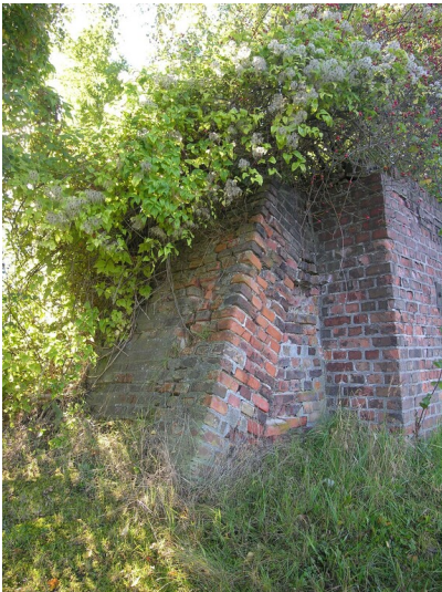
Anschlussbahn zur Fabrik Webau mit Verladerampe - Rampe mit Stützwänden aus Ziegelmauerwerk