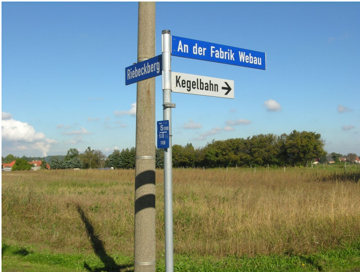
Straße Riebeckberg - Zwei Straßenschilder; ""An der Fabrik Webau"" und ""Riebeckberg"" (um 2000)