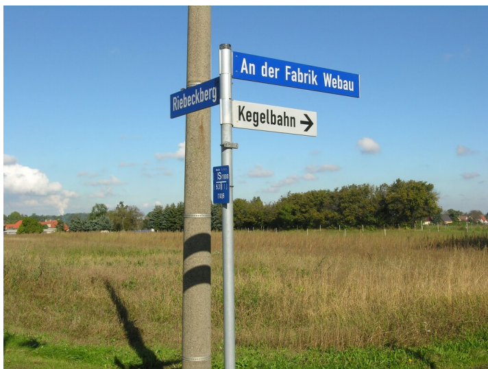
Straße Riebeckberg - Zwei Straßenschilder; "An der Fabrik Webau" und "Riebeckberg" (um 2000)