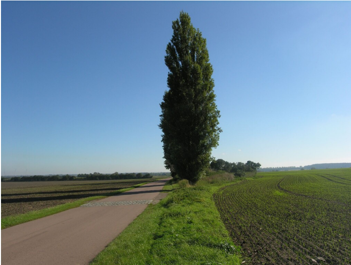
Das Bitterfelder Haus - Beim Bitterfelder Haus, hinter der Pappel rechts des Radweges mit Gebüsch überwachsene Fundamente und Bauschutt; Blick nach Neu-Gerstewitz.