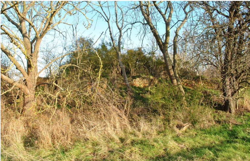
Seilbahn von der Grube Sössen zur Fabrik Alt-Gerstewitz - Anfangsstation der Seilbahn an den Tagesanlagen der Grube Sössen. Von hier wurde die Kohle losgeschickt zur Fabrik Neu-Gerstewitz.