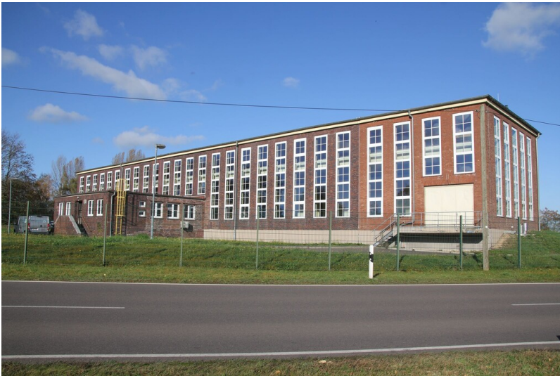
Wasserwerk des Hydrierwerks Zeitz - Gesamtansicht straßenseitig