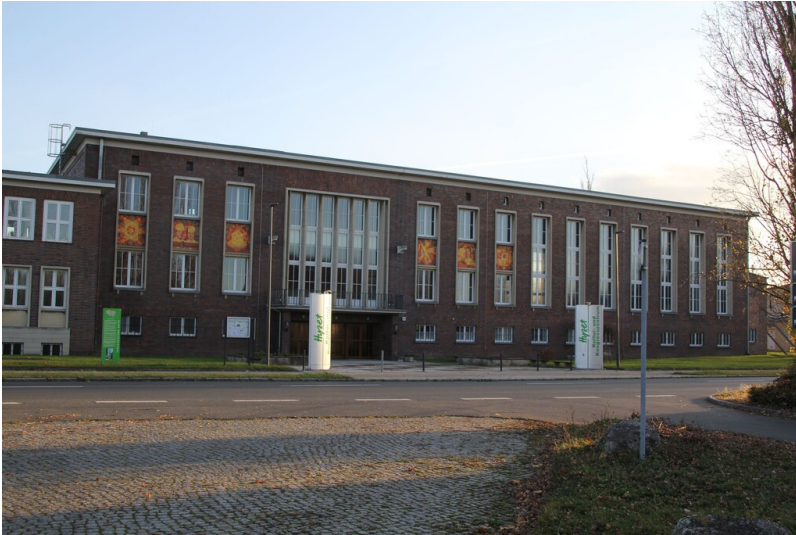
Kulturhaus des Hydrierwerks Zeitz - Straßenansicht des ehemaligen Kulturhauses vom Hydrierwerk Zeitz