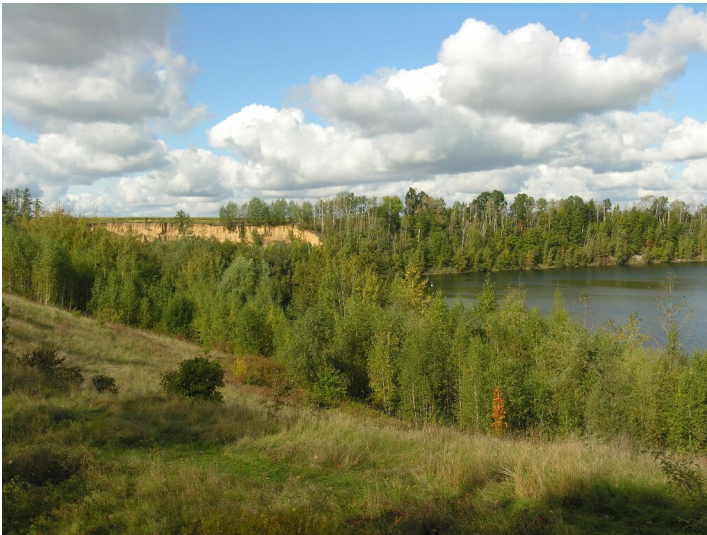
Tagebau der Prehlitzer Braunkohlen AG - Tagebaurestloch als See; Blick N, links der Bergrutsch mit quartärgeologischem Profil

Schlagwörter: Tagebau Fachsicht(en): Denkmalpflege Gemeinde(n): Elsteraue Kreis(e): Burgenlandkreis Bundesland: Sachsen-Anhalt