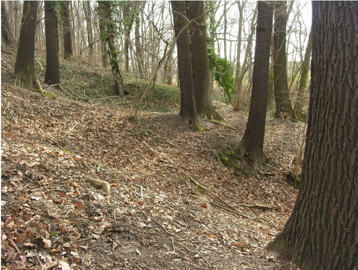
Schächte der Tiefbaue Gruben 47-55 - kleine Mulden am Waldhang; Blick S