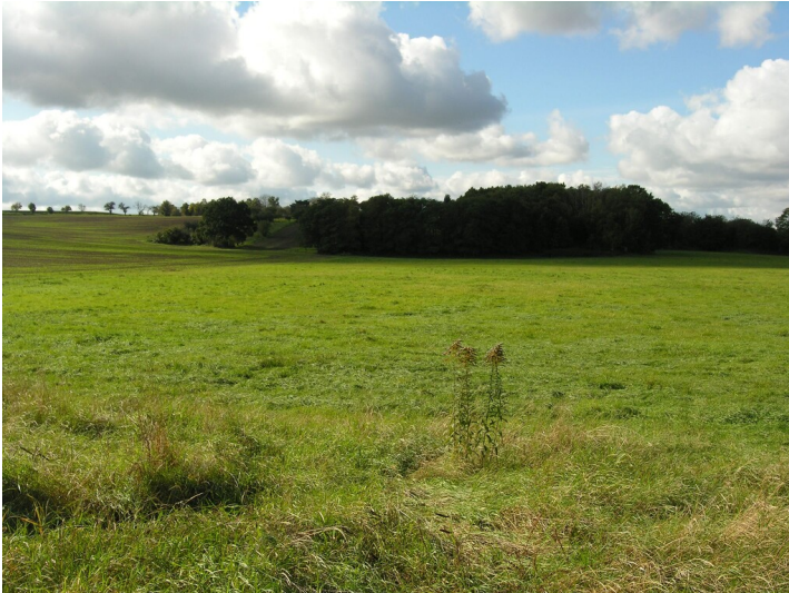
Tagebau der Grube 279 Vereinsglück III - verfüllter Tagebau; Blick W, nach Oelsen

Schlagwörter: Tagebau Fachsicht(en): Denkmalpflege Gemeinde(n): Elsteraue Kreis(e): Burgenlandkreis Bundesland: Sachsen-Anhalt