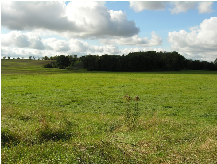
Tagebau der Grube 279 Vereinsglück III - verfüllter Tagebau; Blick W, nach Oelsen

Schlagwörter: Tagebau Fachsicht(en): Denkmalpflege Gemeinde(n): Elsteraue Kreis(e): Burgenlandkreis Bundesland: Sachsen-Anhalt