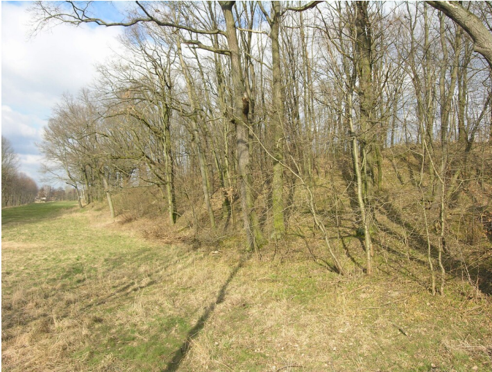
Bergbauverdachtsfläche zu den Gruben 47-55 - kleine Mulden im bewaldeten Hang; Blick N