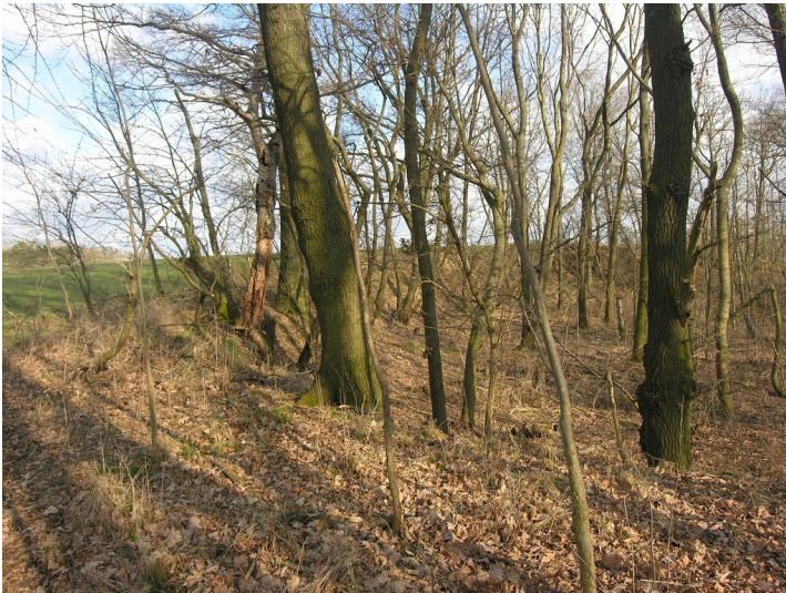
Tagebau der Grube 139 - bewaldetes Tagebaugelände; Blick SE