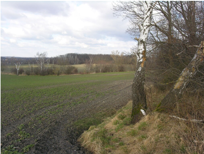
Bahnanschlussgleis der Grube Hermannschacht - der Damm in der Gebüschgruppe, Bildmitte; Blick NE