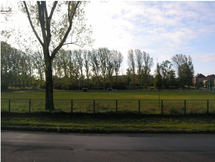
Älterer Tagebau der Grube Neuglück - an Stelle des Tagebaus heute ein Fußballfeld; Block S

Schlagwörter: Tagebau Fachsicht(en): Denkmalpflege Gemeinde(n): Elsteraue Kreis(e): Burgenlandkreis Bundesland: Sachsen-Anhalt