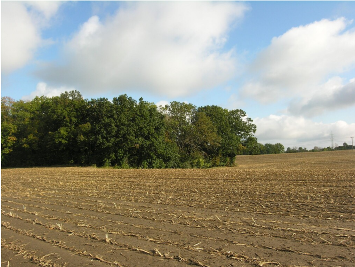
Bruchfeld unbekannter Gruben (um 1860) - das Bruchfeld innerhalb der Baumgruppe, links; Blick NE