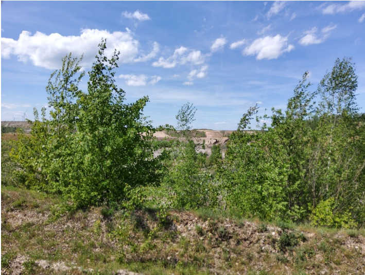
Baufeld Ia - Das Abbaufeld Ia ist wieder verfüllt und rekultiviert, bzw. renaturiert.

Schlagwörter: Tagebau Fachsicht(en): Denkmalpflege Gemeinde(n): Elstertrebnitz Kreis(e): Leipzig Bundesland: Sachsen