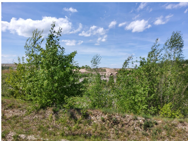
Baufeld Ia - Das Abbaufeld Ia ist wieder verfüllt und rekultiviert, bzw. renaturiert.