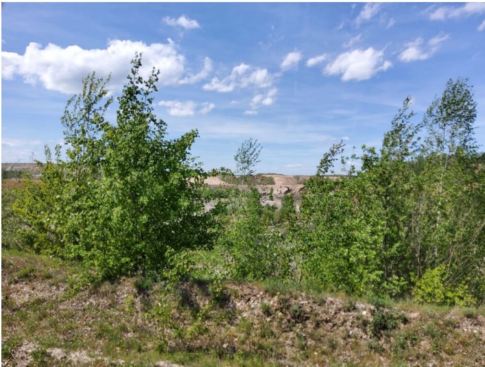
Baufeld Ia - Das Abbaufeld Ia ist wieder verfüllt und rekultiviert, bzw. renaturiert.

Schlagwörter: Tagebau Fachsicht(en): Denkmalpflege Gemeinde(n): Elstertrebnitz Kreis(e): Leipzig Bundesland: Sachsen