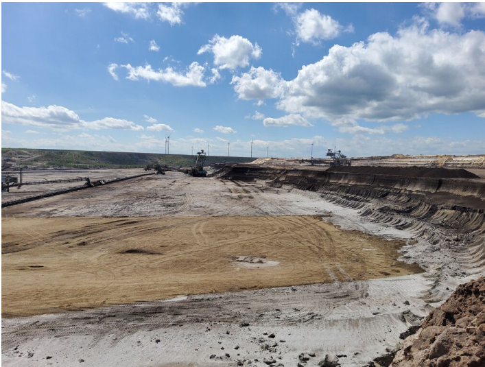
Abbaufeld Profen-Nord - Blick in den Tagebau