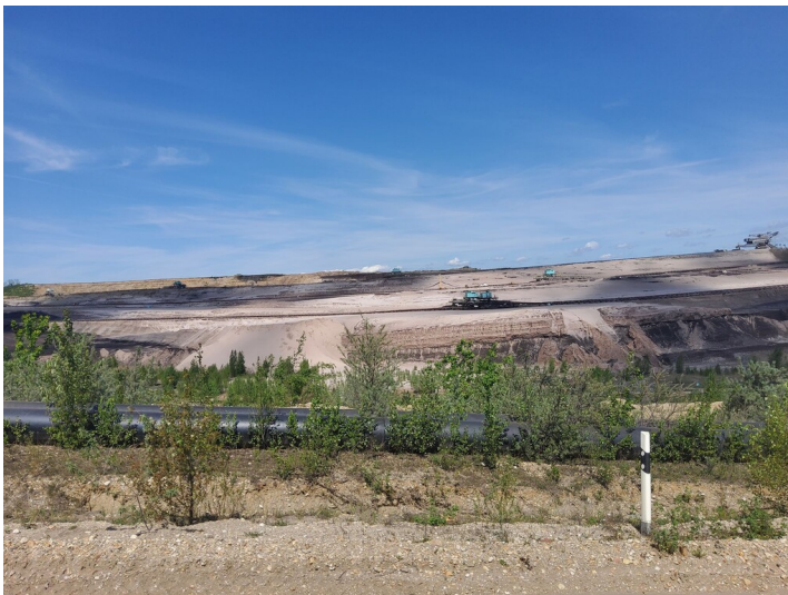
Abbaufeld Profen Süd/D1 (Profen Süd) - zur Zeit wird das Abbaufeld wieder verfüllt und die Böschungen befestigt