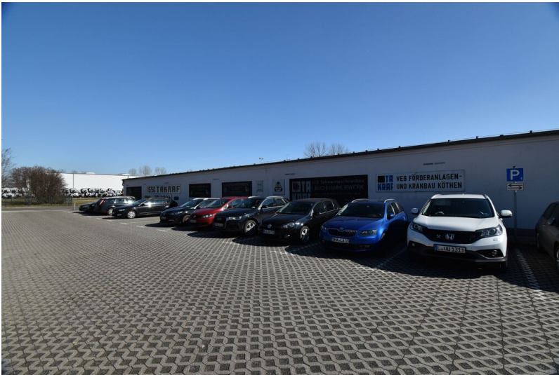
Profen Village - Sammlung von Bagger-Typentafeln