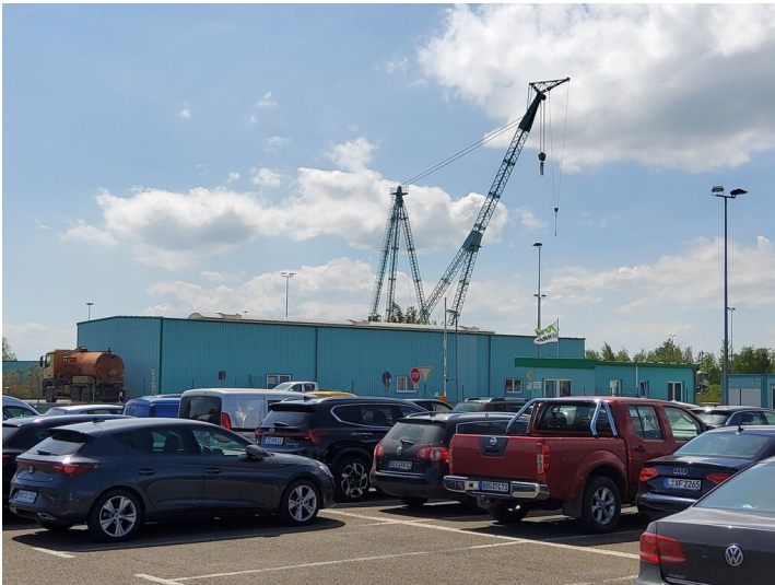
Tagebau Profen Tagesanlagen - Lagergebäude (Portalkran des VEB Kranbau Köthen im Hintergrund)