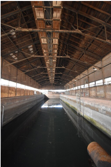
Ziegelei Reuden - ehemaliges Sumpfhaus zum Einsumpfen des Tones vor der Verarbeitung