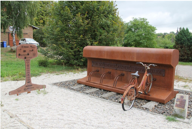
Bahnhof Droyßig (1897) - Vorplatz