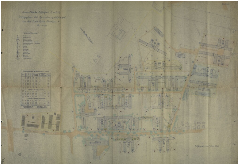
Gemeinschaftslager Schkopau - Plan des Gemeinschaftslagers Schkopau 1942 (LASA, I 528, Nr. 67, Bl. 1), bearbeitet von Schröder, Sarah