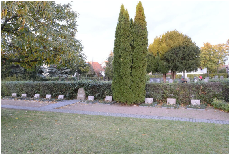
Gedenkstätte für Zwangsarbeiter

Schlagwörter: Gedenkstätte Fachsicht(en): Denkmalpflege Gemeinde(n): Leuna Kreis(e): Saalekreis Bundesland: Sachsen-Anhalt