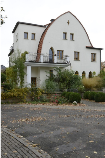
Siedlung ""Eigenheim""