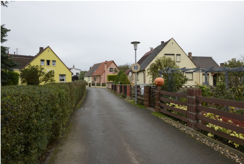
Siedlung "Annemariental" - Siedlung "Annemariental" Merseburg