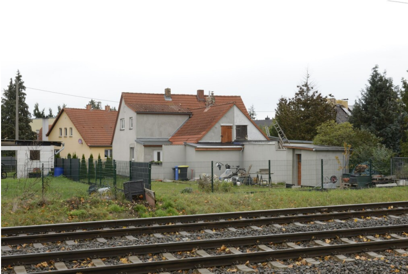
Siedlung "Elisabethhöhe"