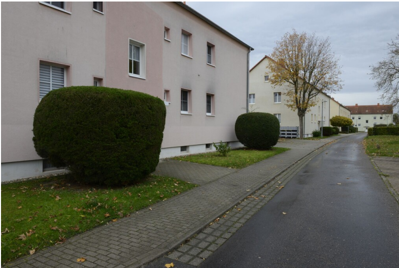
Siedlung ""Wassertal""