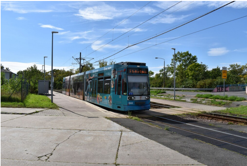
Überlandstraßenbahn Halle - Bad Dürrenberg - Strecke bei Schkopau