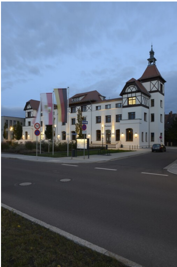
Kurhaus Bad Dürrenberg - Kurhaus Bad Dürrenberg