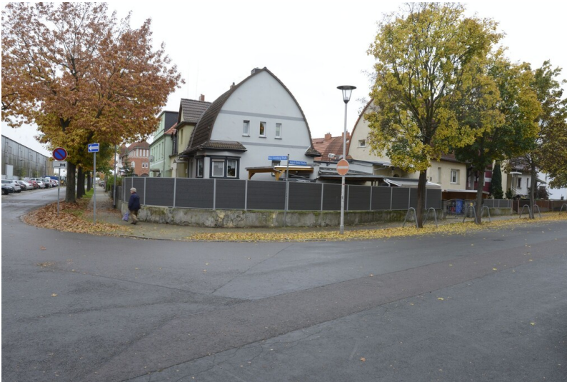
Erweiterungsbereich der Großsiedlung GAGFAH