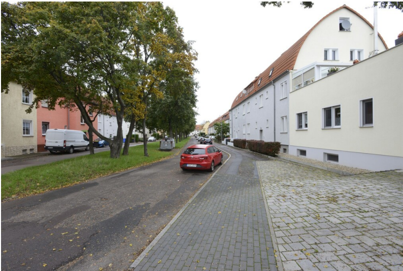
Großsiedlung GAGFAH