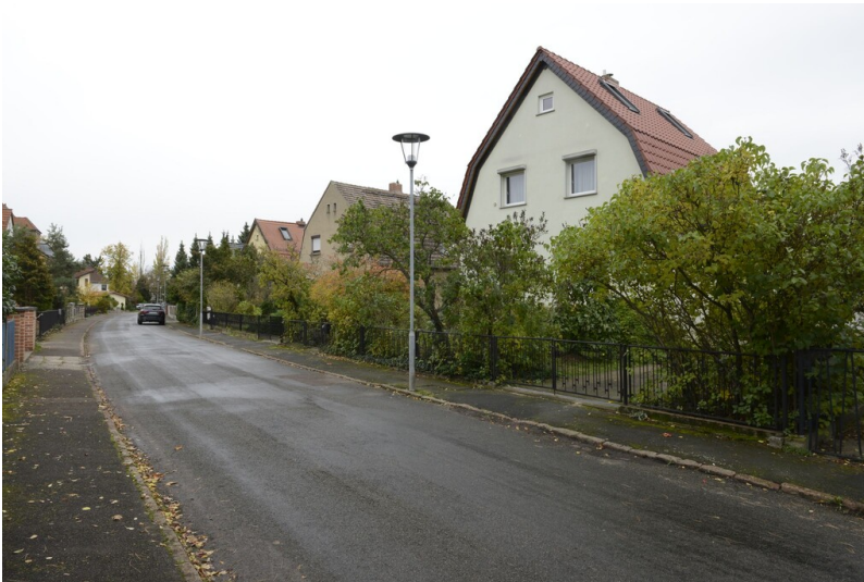
Rentenguts-Siedlung II Fotograf/Urheber: NAME FEHLT