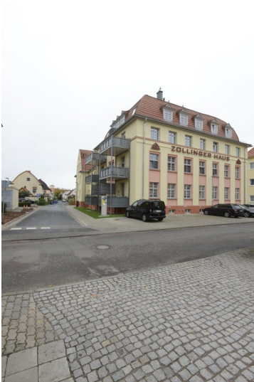
Wohlfahrts- und Arbeitsamt - Zollinger-Haus