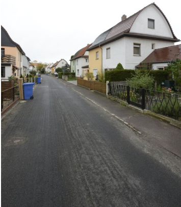
Siedlung Klaus