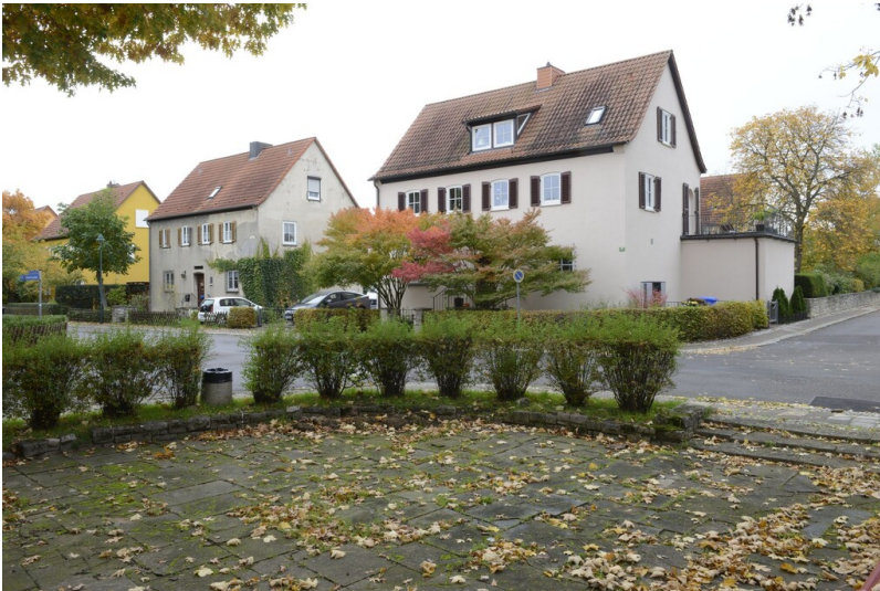
Siedlung II der Buna-Werke - Siedlung II der Buna-Werke in Schkopau