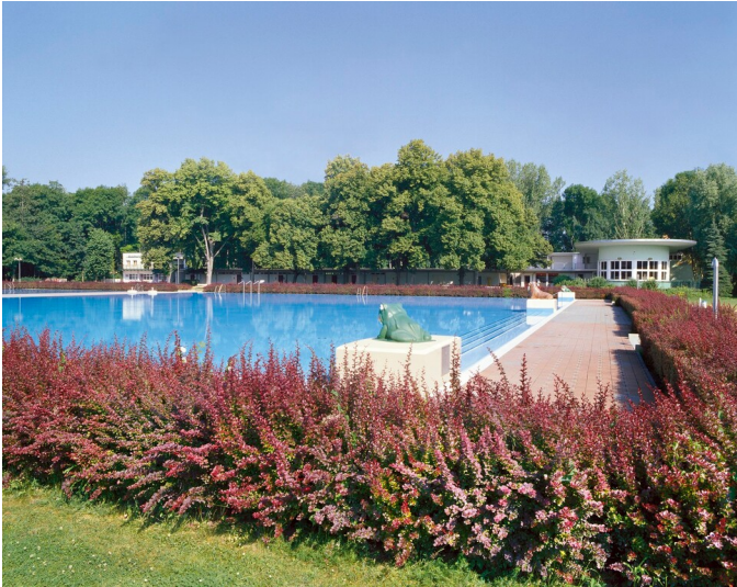
Waldbad Leuna - Das modernisierte Freibad