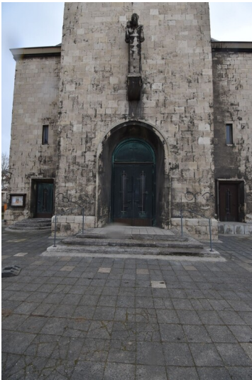
Evangelische Friedenskirche Leuna