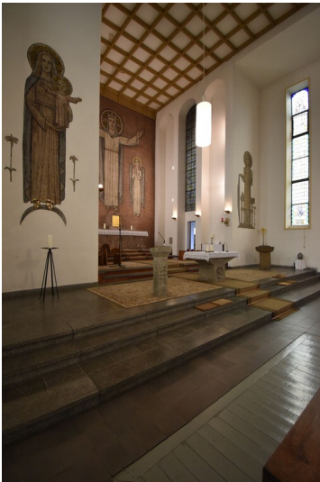
Katholische Kirche Christkönig Leuna