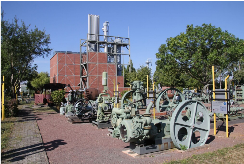
Deutsches Chemie-Museum Merseburg - Blick über das Ausstellungsgelände mit Winkler-Generator im Hintergrund