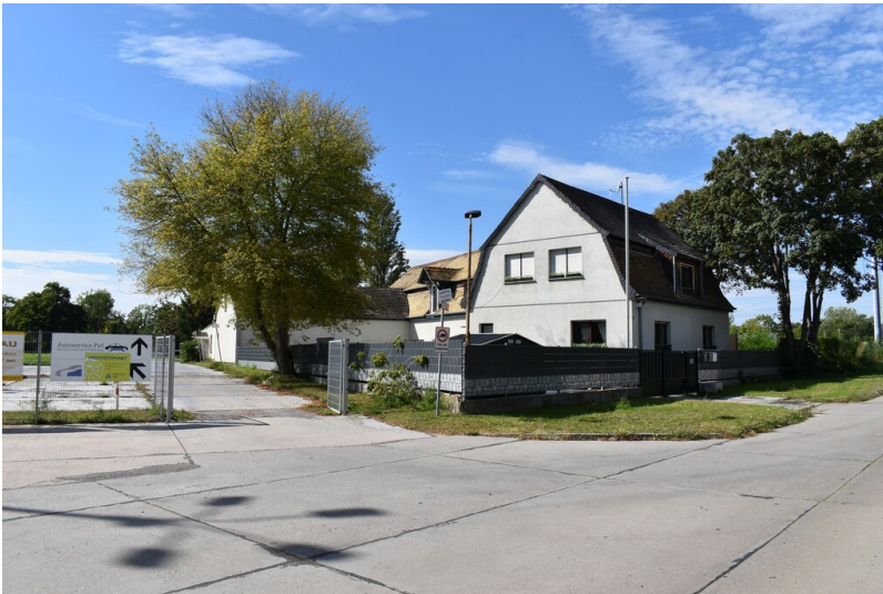
Siedlung Schkopau

Schlagwörter: Siedlung Fachsicht(en): Denkmalpflege Gemeinde(n): Schkopau Kreis(e): Saalekreis Bundesland: Sachsen-Anhalt