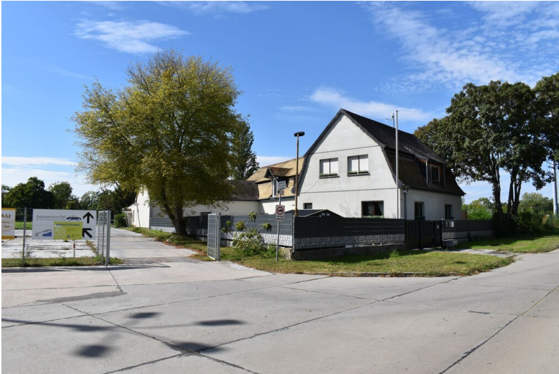
Siedlung Schkopau